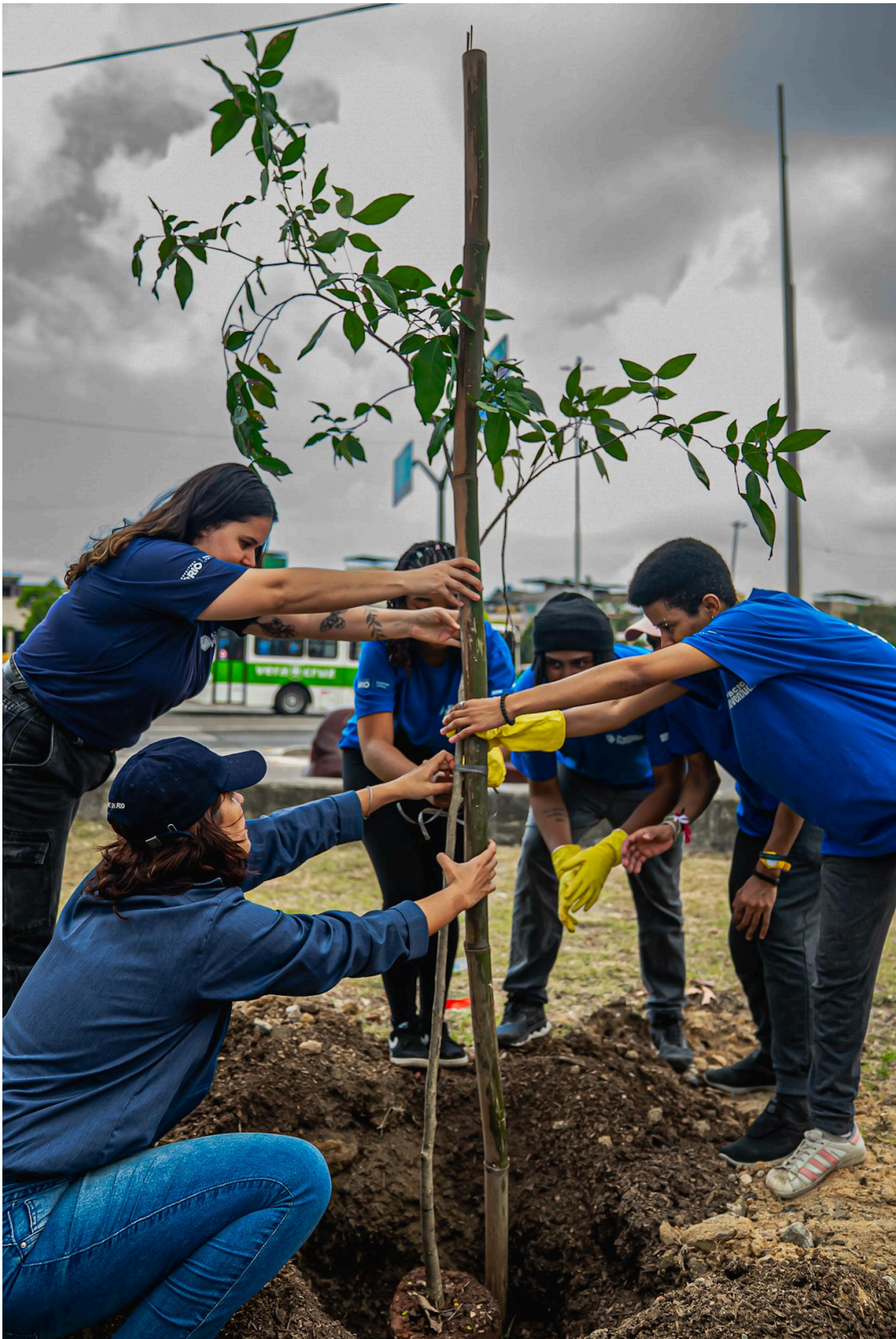
Imagem 8 - Realização do Mutirão Verde na Av. Brasil