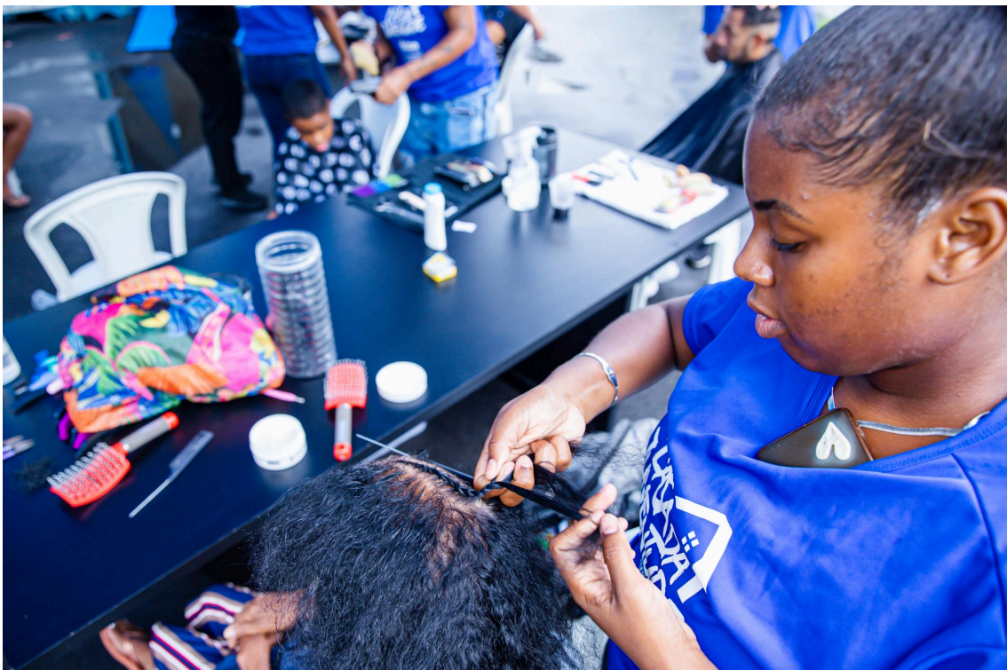
Imagem 2 - Oficina de trança na Casa da Juventude