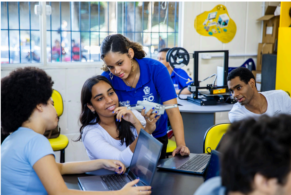
Imagem 7 - Aula do curso de Operador de Drone no Espaço da Juventude