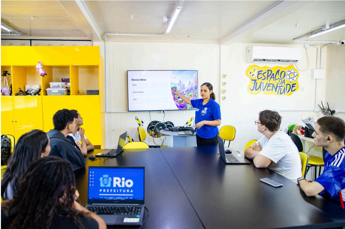
Imagem 1 - Aula no Espaço da Juventude