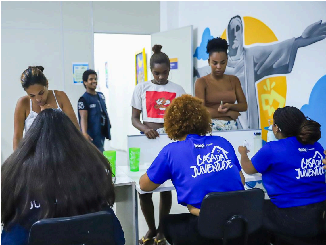
Imagem 5 - Atendimento aos jovens na Casa da Juventude do Centro