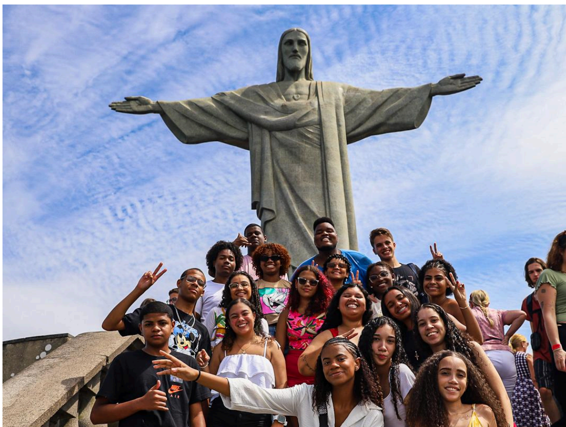
Imagem 7 - Foto de visita guiada dos jovens ao Cristo Redentor pelo Nosso Rio