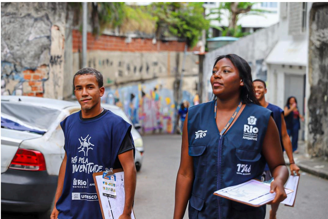
Imagem 2 - Equipe do Pacto pela Juventude