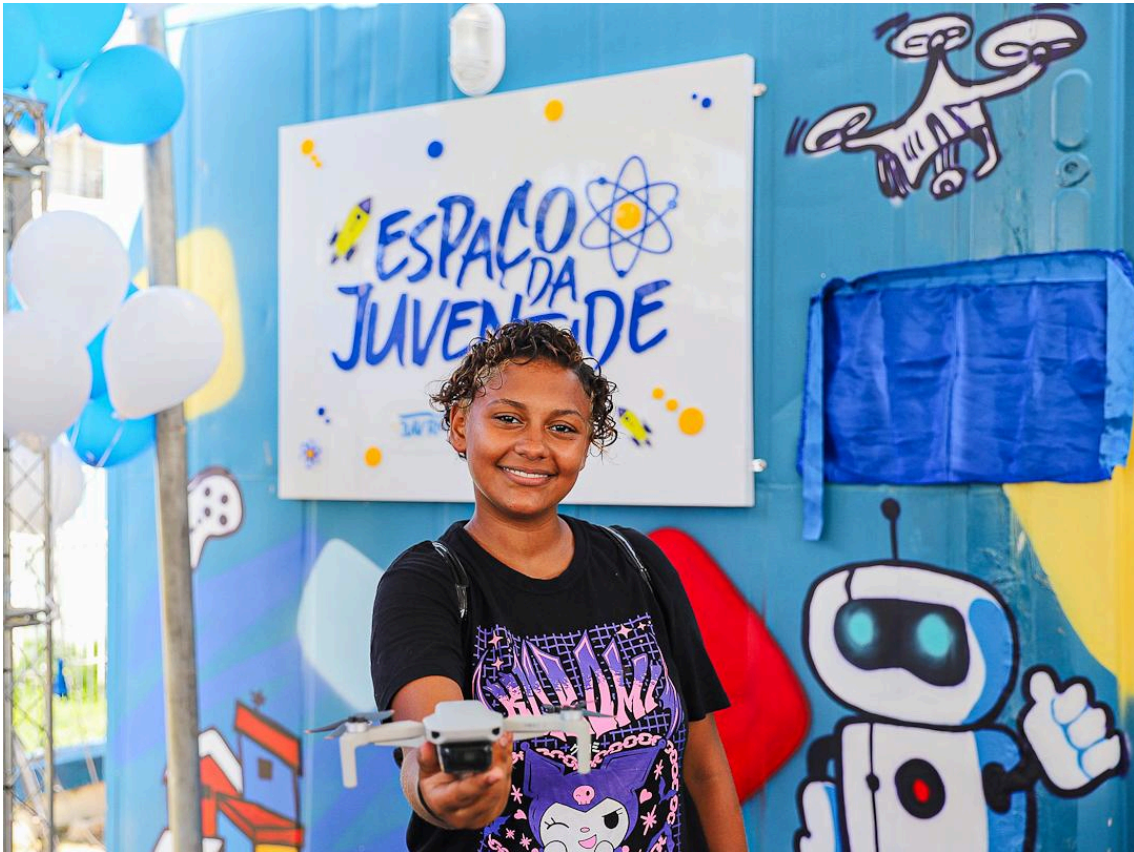
Imagem 1 - Aluna do curso de Operador de Drone do Espaço da Juventude